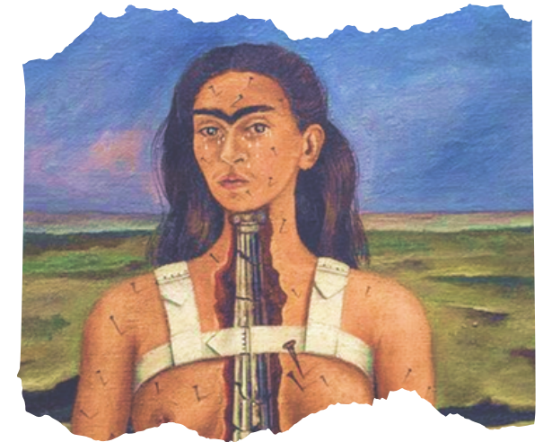
© Frida Kahlo, The Broken Column, 1944

Approches psychanalytiques, sociales et artistiques